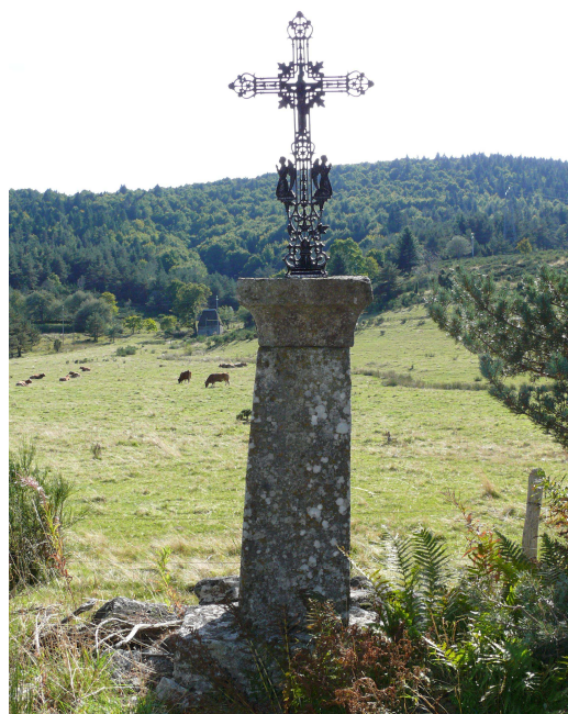
Croix de la Cassonié

A côté de la grande croix de la place il y a un grand bassin qui avec les travaux de 2009 aura subi quelques modifications. Les deux hameaux de La Palisse et de la Rochette ont aussi leur croix près d'un bassin, même si elle est beaucoup plus modeste, surtout à La Rochette. La croix et l'eau étant les deux principaux signes ou symboles de la vie que Dieu donne par le baptême. Au centre de la croix de la Palisse est représentée la Vierge Marie, tenant dans ses bras son enfant, conçu du Saint Esprit, et donc Fils de Dieu, venu en ce monde pour révéler aux hommes l'Amour du Dieu Père, Fils et Esprit Saint, leur donnant la plus grande preuve de cet amour en mourant pour eux sur une croix. Il y avait aussi à La Palisse une deuxième croix près de l'école. Il en reste encore le piédestal et le socle qui ont les mêmes dimensions que ceux de la première.