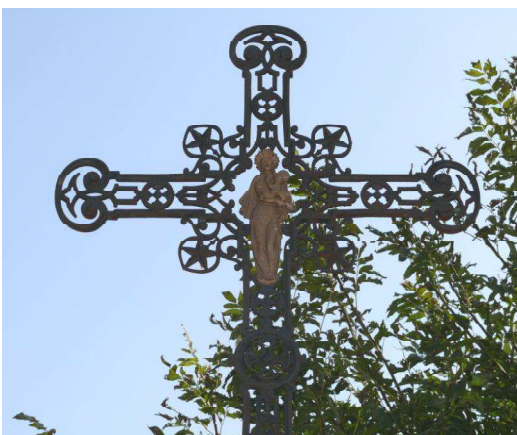
Détail de la croix de La Palisse