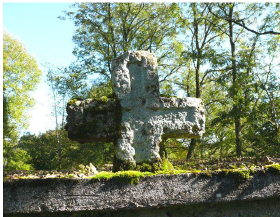
Croix de la Rochette

L'ange dit l'encyclopédie Theo « est un être imaginé par l'homme, être composite, mixte de Dieu et de l'homme ». C'est en quelque sorte un être, un esprit indéfinissable qui dans la Bible a pour mission d'établir le contact entre l'homme et Dieu : c'est un ange qui a annoncé à Marie qu'elle serait la mère du Fils de Dieu ; c'est un ange qui a prévenu Joseph de la menace que faisait peser Hérode sur la vie de