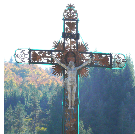
Détail de la croix du village

Au Cros, comme dans la plupart des communes, la plus grande, la plus haute croix se dresse depuis un siècle environ sur la place publique du chef-lieu, à l'emplacement de l'ancienne église romane du 12 ème siècle qui venait d'être démolie. Le socle et le piédestal sont en pierre de pays (granit). Le piédestal comporte 4 marches dont l'inférieure mesure quatre mètres sur chaque côté et la supérieure deux mètres vingt sur chaque côté. L'ensemble piédestal socle, mesure plus de trois mètres de haut. La croix métallique peut mesurer cinq à six mètres : les bouquets d'épis de blé, les grappes de raisin et les feuilles de vigne qui la décorent font référence à l'eucharistie. Il y a au-dessus de la tête du Christ le titulus aux quatre lettres I N R I qui sont les initiales de Jésus de Nazareth roi des juifs : on trouve pareil titulus sur la croix du Gendarme.