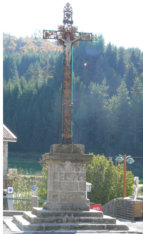
Croix de la place du village