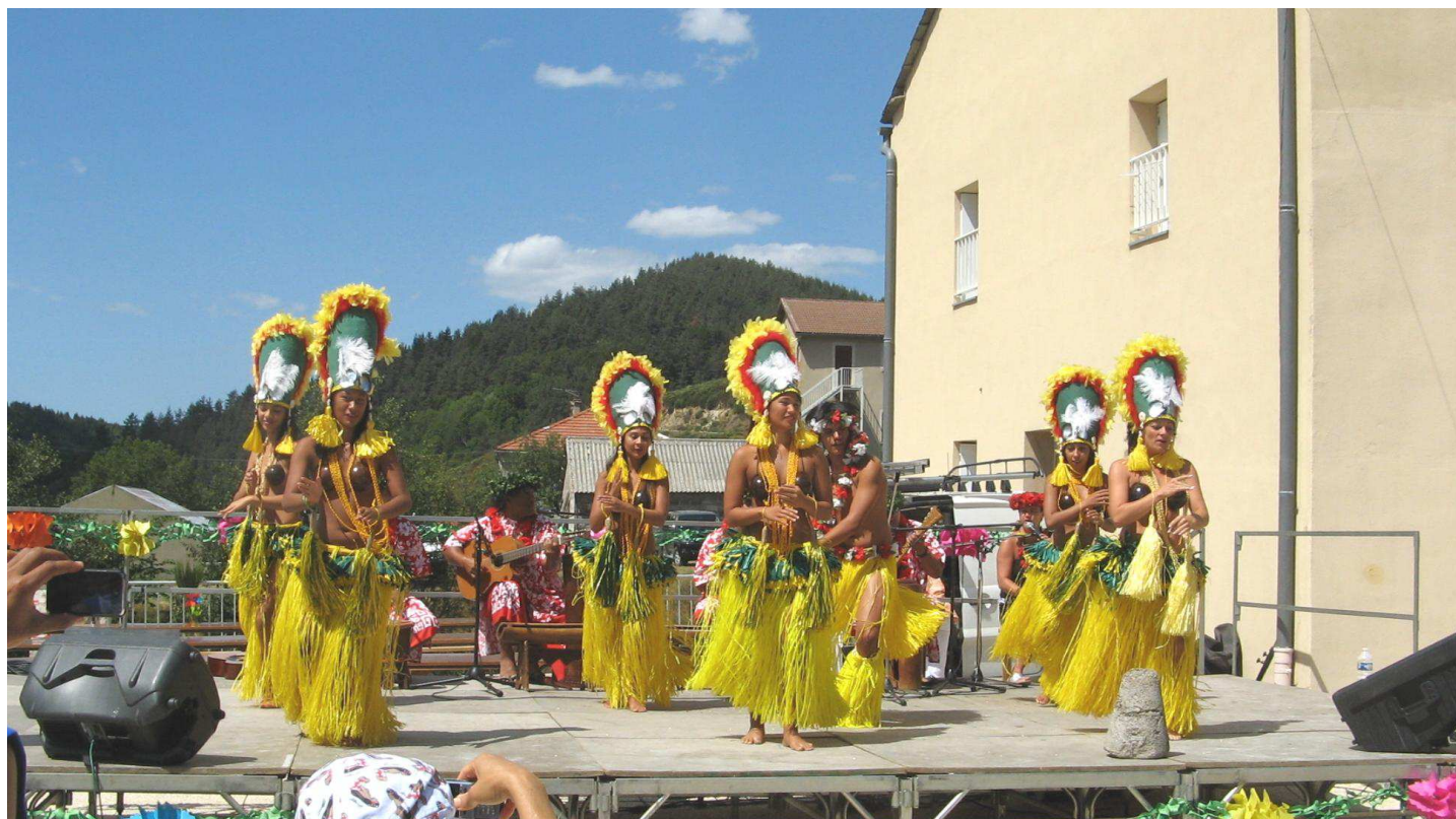
Fête des îles le 15 août 2009