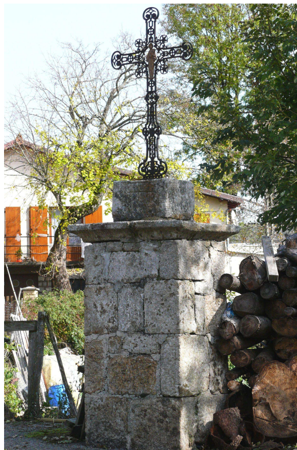
Croix de La Palisse

Mais revenons à la grande croix de la place publique du village, premier lieu de rassemblement de la population. C'est là que le garde champêtre, aux années de mon enfance, vers 1940, après avoir fait entendre le son du tambour, faisait les annonces publiques à la sortie des offices religieux. C'est là que les marchands de fruits ou autres s'installaient en été le dimanche matin. L'épicerie d'Angéline ne désemplissait pas. Autour de la place, non loin de la croix, les hommes s'attardaient dans les cafés et buvaient pinto ou quelques canons . Pour les non initiés une pinto c'était un bouteille contenant un demi litre de vin, alors qu'un canon était un verre rempli de vin. Pendant ce temps les femmes de leur côté, c'était plus rapide, prenaient entre amies leur tasse de café, les enfants aussi par petits groupes, dès qu'ils ne s'accrochaient plus à la jupe de leur mère, s'asseyaient autour d'une table et prenaient du plaisir à boire leur verre de limonade.