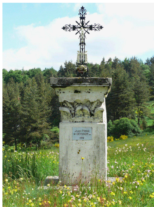
Croix du gendarme

Au Cros, comme dans la plupart des communes, la plus grande, la plus haute croix se dresse depuis un siècle environ sur la place publique du chef-lieu, à l'emplacement de l'ancienne église romane du 12 ème siècle qui venait d'être démolie. Le socle et le piédestal sont en pierre de pays (granit). Le piédestal comporte 4 marches dont l'inférieure mesure quatre mètres sur chaque côté et la supérieure deux mètres vingt sur chaque côté. L'ensemble piédestal socle, mesure plus de trois mètres de haut. La croix métallique peut mesurer cinq à six mètres : les bouquets d'épis de blé, les grappes de raisin et les feuilles de vigne qui la décorent font référence à l'eucharistie. Il y a au-dessus de la tête du Christ le titulus aux quatre lettres I N R I qui sont les initiales de Jésus de Nazareth roi des juifs : on trouve pareil titulus sur la croix du Gendarme.